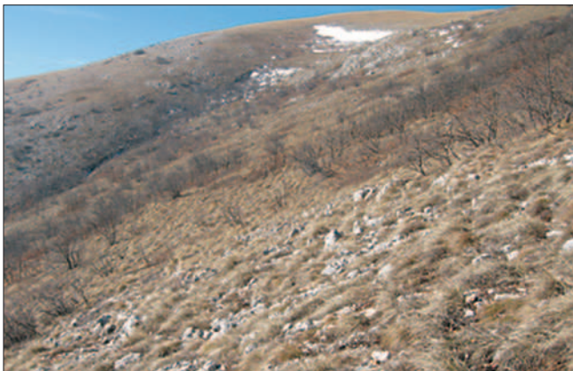
Slika 3. Pokusna ploha “Kolino” Figure 3 Sample plot “Kolino”

Na ovoj plohi, koja je jedina sjeverne ekspozicije i ima najveći obrast, evidentirano je najviše kamenjarke u promatranom razdoblju. Tu je zabilježen i najveći broj jedinki u jatima (7 jedinki u 2003. i 2004. g.), a od 2003. g. kamenjarke se tu nalaze redovno svake godine. Razlog ovakvom brojnom stanju mogao bi se naći u nepristupačnom terenu (skeletno tlo s brojnim jamama i procijepima) koji je u kombinaciji sa snijegom tijekom lovne sezone teško prohodan, pa je zato rijetko posjećen od krivolovaca.