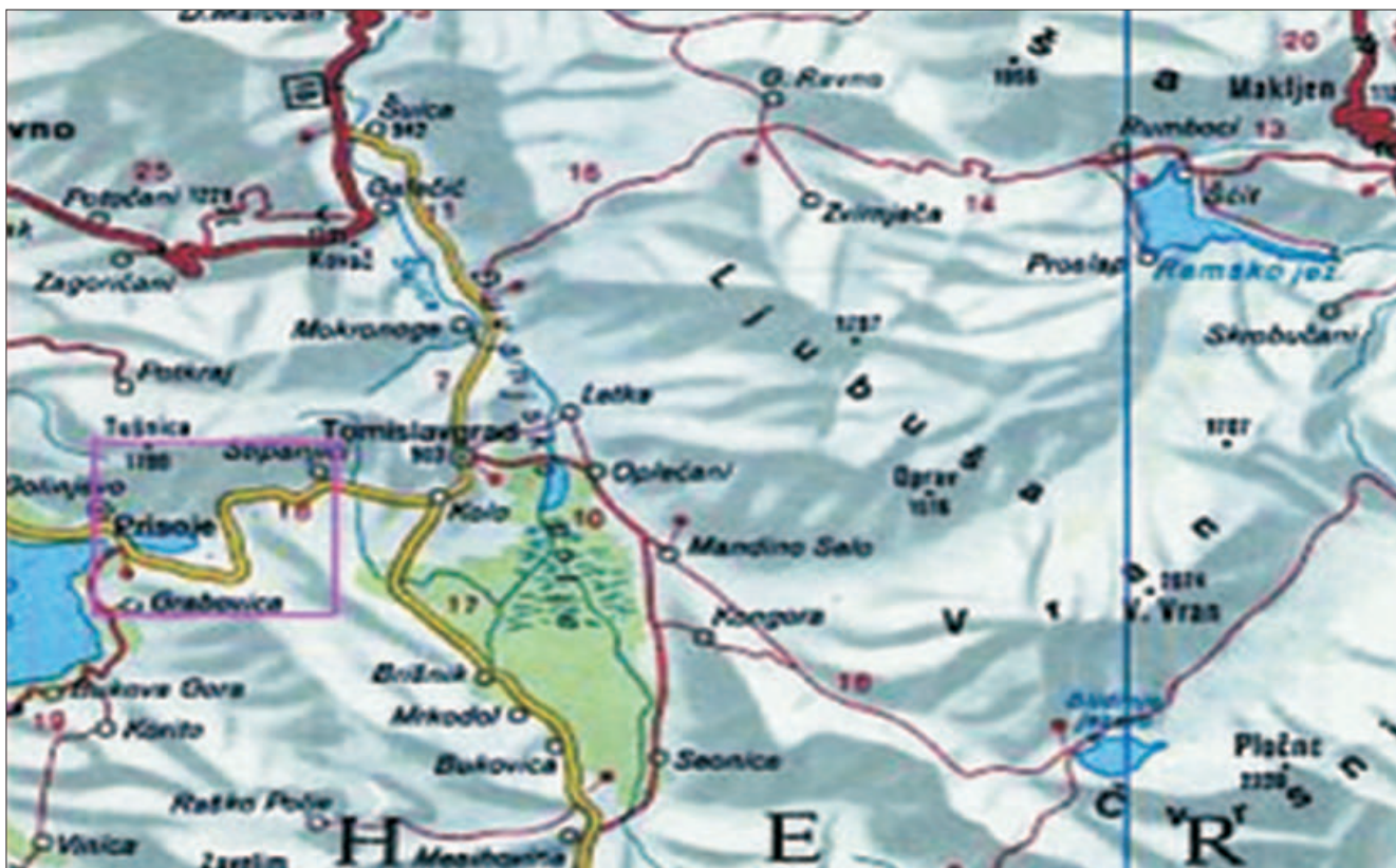
Slika 1. Karta šireg područja istraživanja s označenim područjem pokusnih ploha Figure 1 Map of larger research area with marked area of sample plots

jarebice kamenjarke najčešće mogu naći tijekom lovne sezone.