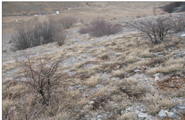
Slika 4. Pokusna ploha “Jasllice-Salakovac” Figure 4 Sample plot “Jasllice-Salakovac”