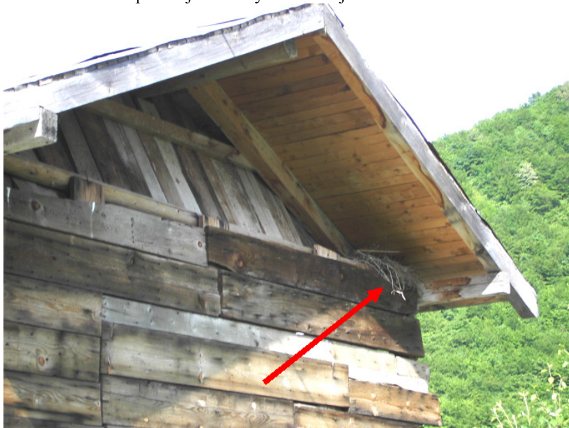
Сл. 6. Гнијездо вјетруше ( Falco tinnunculus ) на локалитету Нахорево

У периоду 01-03.05.2005., три пута је регистрован један мужјак изнад отворених травнатих станишта и смрчево-јелове шуме на Козјачи.