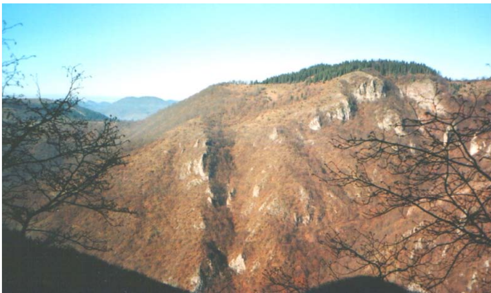
Сл. 3. Падине Козјаче