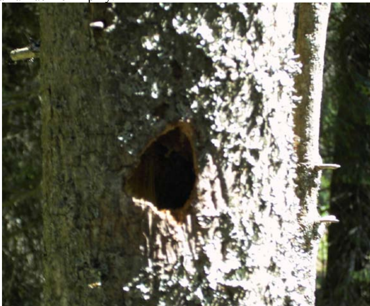
Сл. 7. Гнијездо планинске сјенице ( Parus montanus ) у дрвету смрчево-јелове шуме на Скакавцу

Иако није често уочавана, забилежена је у свим типовима шума (осим борових). Гнијежђење је констатирано у четинарским шумама на Скакавцу (сл.7), те у каменитим стаништима на Хасином Кршу.