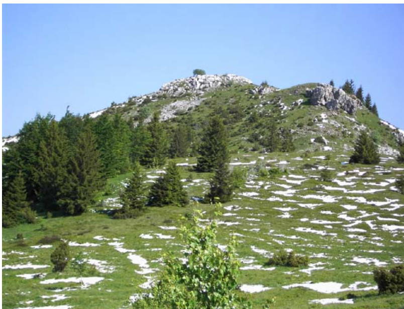
Сл. 2. Врх Црепољско (1525 м)

Подручје Озрена одликује се високим степеном разноликости у погледу орографије, хидрологије и климе. У орографском погледу, на подручју Озрена, забиљежени су бројни врхови, долине, кањони, клисуре, усјечи и вртаче. Равних терена је веома мало. Унутар истраживаног дијела Озрена највиши врх је Буковик (1532 м), затим Црепољско брдо (1525 м), који са Козјачом (1500 м) представља једну цјелину. Геолошки гледано, доминирају формације доњег и средњег тријаса, док су дјелимично присутне креда и јура, те миоцен и квартар. На истраженом дијелу доминирају аутоморфна тла, која покривају веће површине у односу на хидроморфна тла. У хидролошком погледу, водотоци Озрена припадају Посавском сливу. Својим значајем посебно се истиче водопад Скакавац, висине 98 метара (Redžić et al., 2001). Климатски посматрано, подручје Озрена углавном припада континенталној клими, са снажним утицајем одређених варијанти планинске климе. Поред тога, усљед специфичног положаја, на јужним падинама је присутан утицај субмедитеранске климе. Такођер, у кањонима појединих водотока су забиљежене температурне инверзије (Milosavljević, 1963).