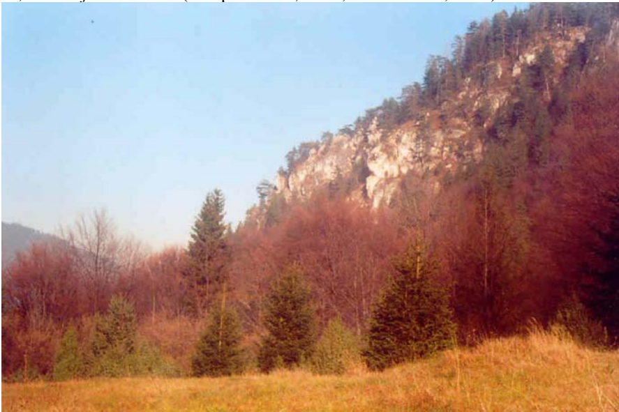
Сл. 5. Шуме и ливаде на подручју Скакавца

дејствима уништене инфраструктуре, нешто мање посјеђена. С друге стране, само су доње падине Озрена (дио према Сарајеву-Фалетићи, Нахорево) и дијелови према Палама, знатније насељени (Prospect C&S, 2005; Redžić et al., 2001).