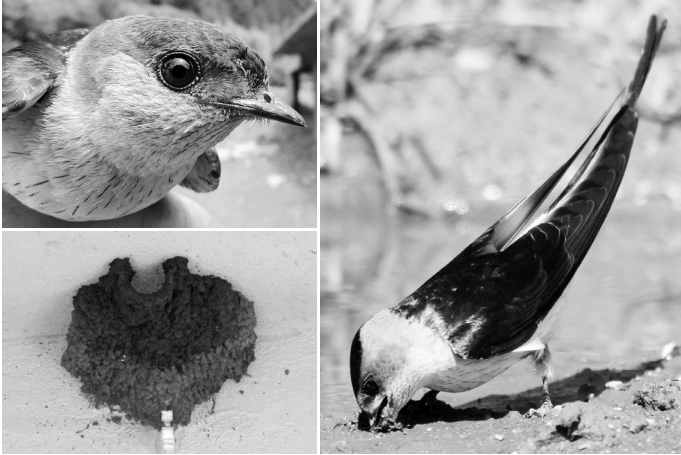
Slika 2-4. Dauriska lastavica zabilježena u okolini Žepča Figures 2-4. Red-rumped Swallow recorded near Žepče