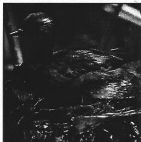
Ušati gnjurac - Podiceps auritus L. (na njemačkom: Ohrentaucher)

Ridogrlji gnjurac zimuje većinom u širem području gniježdenja. Isključivo za jakih zima seli južnije, u zone Sredozemlja, Crnoga i Kaspijskog mora.