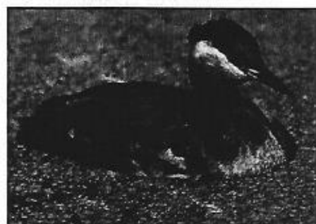
Ridogrlji gnjurac - Podiceps griseigena odd. (na njemačkom: Rothalstaucher)

Ovaj se gnjurac pojavljuje za selidbe i zimovanja. U većem dijelu zemlje je rijedak te se opaža za jakih zima. Po izgledu je donekle sličan čubastom gnjurcu, ali je manji.